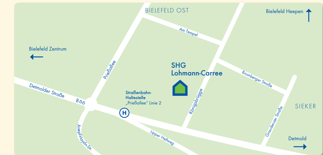
Lageplan SeniorenHausgemeinschaft „Lohmann-Carree“